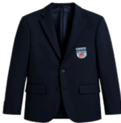
VESTON AZUL CON INSIGNIA BORDADA