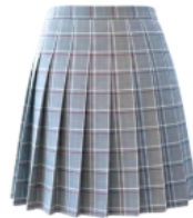
FALDA ESCOCESA GRIS