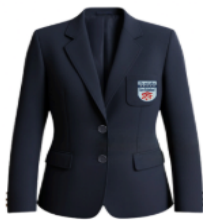
VESTON AZUL CON INSIGNIA BORDADA